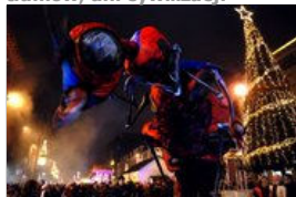
Fiesta na George Street

Boisz się, że drogowców znowu zaskoczy zima, a Ciebie Sylwester przed telewizorem? Podpowiadamy, kto rozkręca najlepsze imprezy, a gdzie w przywitaniu Nowego Roku nie przeszkodzi ani obecność tłumów, ani cywilizacji