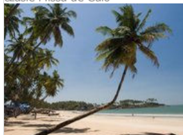
Palmy na Goa