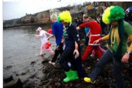
Noworoczna kąpiel w zatoce Firth of Forth