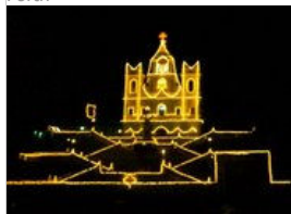
Kościół Niepokalanego Poczęcia w czasie Missa de Galo